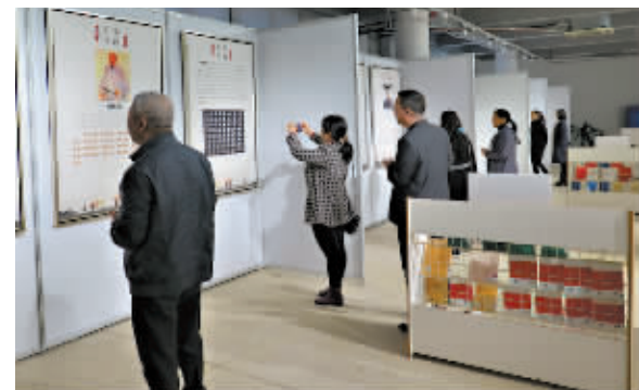
中华家训家规好家风现场。

据悉, 此次展览为期一个月, 从即日起至2017年1月6日结束, 其间将以党(工)委为单位, 每日组织一至两个党(工)委的党员干部前往参观学习, 确保学习教育全覆盖。