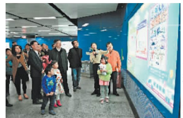
广州地铁活动现场。

广州地铁集团举办了“地铁好家风”员工子女绘画大赛活动。活动得到该集团广大员工及家属、子女的积极参与, 参赛小朋友紧扣主题, 创作了大量既充满童趣又寓意深刻的绘画作品, 充分体现了广州地铁员工家庭“遵纪守法、诚信友善、勤俭节约、尊老爱幼、文明礼貌”的良好家风。