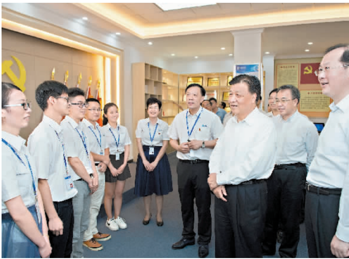
5月23日,刘云山在广州市国光电器股份有限公司同员工亲切交谈。 新华社发

度,特别是贫困地区要着力做好精准扶贫、精准脱贫的工作,发挥好党组织战斗堡垒作用。 在乐昌市黄盆村和英德市锦田村、英红镇综合服务中心,刘云山仔细询问“两学一做”学习教育情况,听取党员干部的意见建议。刘云山说,“两学一做”基础在学,要把自己摆进去,联系实际认真学习党章党规确立的遵循和规范,深入领会习近平总书记系列重要讲话的基本要求。要对准问题去、带着问题改,把学习教育同加强基层党组织建设结合起来,同加强党员日常教育管理结合起来,同解决群众关心的实际问题结合起来,具体化、接地气、见实效,防止搞没有实质内容、花里胡哨的东西,防止形式主义、走过场。