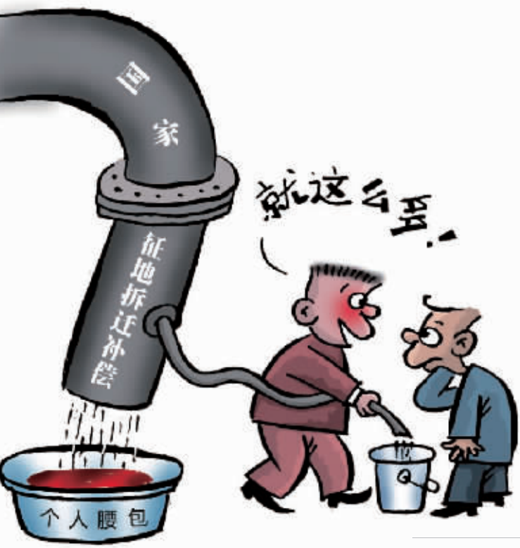
选自《以案释纪》 广州市纪委编