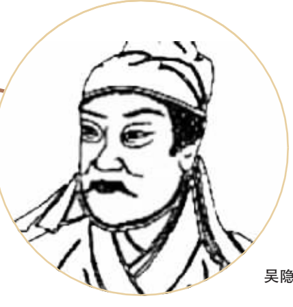
吴隐之 清简勤苦酌贪泉 ——(东晋)吴隐之

廉洁奉公拓铁路 ——詹天佑 詹天佑出生于一个商人家庭。同治十年(1871年),年仅10岁的詹天佑考取官办幼童出洋预备班,赴美留学,毕业于美国耶鲁大学土木工程,尤其长于铁路工程。光绪十三年(1887年),中国铁路公司成立于天津。詹天佑因此成为我国第一位铁路工程师。 在詹天佑主持修建的多条铁路中,京张铁路是我国第一条完全不依赖外国,在资金、技术上完全由中国人自己修筑的铁路。除了技术上的超越,詹天佑主持修建京张铁路的不凡之处,更在于修筑成本的低廉。这离不开詹天佑勤俭节约、廉洁奉公的工作作风。 当时中国铁路大多为借外款修筑,由于技术有限,以致高薪聘用很多高级工程人员。此外,一部分材料采购环节中的回扣、包工过程中的各种陋规等等,都导致铁路修筑过程中多余费用的支出。 詹天佑主持京张铁路修筑时,一方面尽量用华人,减少费用的同时,提高国人修筑铁路的技术和能力。另一方面严格管理,杜绝中间环节可能的贪污和贿赂。在京张铁路施工中,詹天佑就地取材,用自造的水泥和当地的石料建成了一些石桥以代替铁桥,大大降低线路成本。京张铁路修成时,詹天佑上交工程结余款28.8万两白银,被邮传部褒奖为“廉洁自持”。 单襦皂帽志高洁 ——杨匏安 1921年,杨匏安加入共产党,他所居住的杨家祠,成了党在广州活动的重要据点。1924年底,杨匏安被任命为代理中央组织部长,开始从事国共两党复杂的党的统一战线工作。 这时,杨匏安身居要职,难免有亲戚朋友上门求取一差半职。杨匏安坚持任人唯贤,从不徇私滥任,并退回所有礼物。有一年中秋节,有人匿名送来几盒月饼,杨匏安看到十分生气,要求他的家人一定要弄清楚月饼是谁送的,然后把月饼退回去。还有一次,省港罢工委员会在杨家祠分发一笔捐款给罢工工人,麻袋里遗落一个两毛钱的银币,被孩子们捡来玩耍。杨匏安发觉后,立即严肃地批评教育孩子说:这是公家的钱,一分钱都不能拿来玩,叫他们立即送回罢工委员会去。不久,罢工委员会没收了不少走私货物,有人说一部分分给包括杨匏安在内的对罢工有重要贡献的工作人员,杨匏安听后坚决反对,要求将这些罚没私货充公。……公生明,廉生威。” 作为廉洁广州教育读本,《清风峻节——广州历史人物廉洁事略》(以下简称《清风峻节》)选取了广州地区具有突出廉洁事迹的历史人物及部分相关文物资料,在确保相关资料详实、准确的基础上,以人物事略的主要形式来再现广州地区历史人物的廉洁思想与事迹,集中展现广州地区的廉洁历史文化资源与传统。 本书有以下几大特点。一是尊重历史,实事求是。尊重历史原貌,既不因人废事,也不因事废人。具体的人物、事件、地点、年代、数据、事实等力求出处有据,准确可靠。二是述而不论,严谨规范。直书直录,不作总结性的评述,不用粉饰性的语言,述而不论或以史实寓结论。为确保相关资料的详实性、准确性,史料来源力求大体平衡,廉洁事迹突出且史料丰富的人物篇幅可稍长。 具体到内容方面,《清风峻节》选取的历史人物,其清廉事迹脍炙人口,世代相承,从“直言敢谏倡孝治——(东