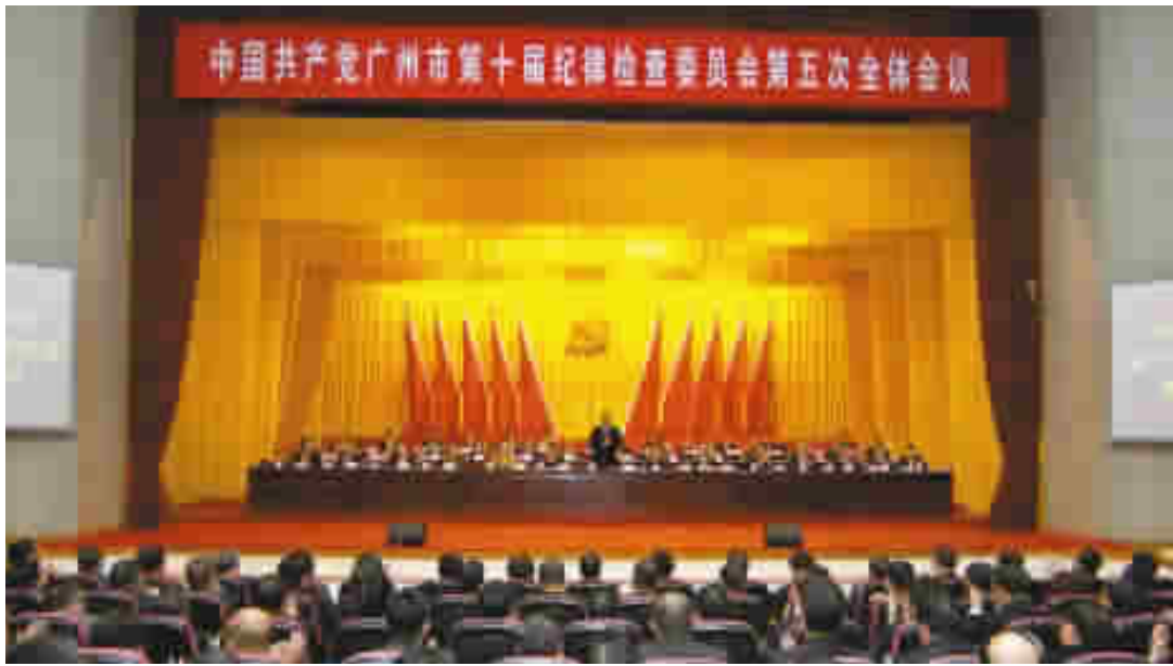
2月6日,十届广州市纪委第五次全会召开。

任学锋指出,习近平总书记在中央纪委五次全会上的讲话,深刻分析了当前反腐败斗争依然严峻复杂的形势,明确提出当前和今后一个时期反腐倡廉工作的总体思路、主要任务和在省纪委四次全会上,省委书记胡春华同志对学习贯彻习近平总书记重要讲话精神进行了重点部署,对2015年工作提出了明确要求。我们要切实把思想和行动统一到习近平总书记重要讲话精神上,按照中央和省、市委的决策部署,增强忧患意识、大局意识、责任意识,坚定不移深入推进党风廉政建设和反腐败斗争。