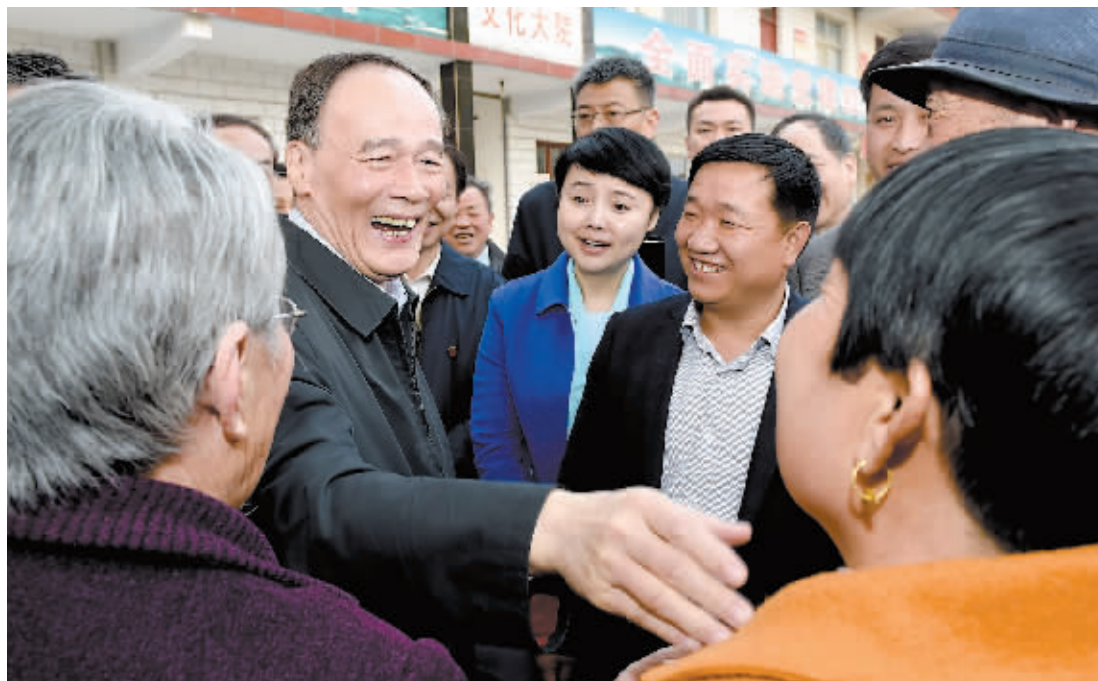
3 月 27 日,王岐山在河南林州市姚村镇冯家口村同村民亲切交谈。

“天网”行动是中央反腐败协调小组部署开展的针对外逃腐败分子的重要行动。有关部门将从今年 4 月开始,综合运用警务、检务、外交、金融等手段,集中时间、集中力量“抓捕一批腐败分子,清理一批违规证照,打击一批地下钱庄,追缴一批涉案资产,劝返一批外逃人员”。