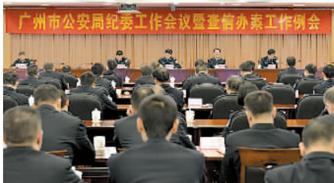
市公安局召开纪委工作会议暨查信办案工作例会。

广州日报讯(记者廖靖文)通讯员沈同川、张志坚摄影报道)3月26日,广州市公安局召开为期一天的纪委工作会议暨查信办案工作例会。副市长、市公安局党委书记、局长谢晓丹出席并作重要讲话。