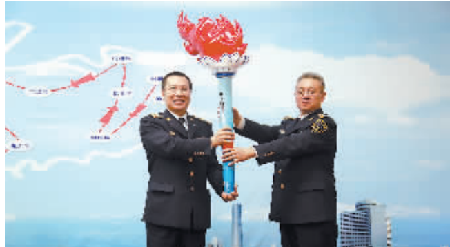
广东海事局廉政火炬传递活动广州站启动仪式现场。

广州日报讯(记者廖靖文)通讯员柏立峰、宋腾飞摄影报道)近期,广东海事局廉政火炬传递活动广州站启动仪式在广州市海珠区举行,广东海事局局长梁建伟、广州市纪委副书记余向阳等出席了活动。廉政火炬寓意“清风海事、平安人生”,激励干部职工做廉洁事当廉洁人。