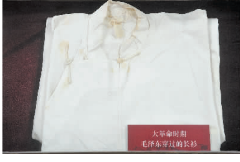
大革命时期 毛泽东穿过的长衫

无论在战争年代还是新中国成立后,毛泽东对子女要求都非常严格,教育子女以勤俭为荣,以吃苦为乐,不能搞特殊化。在毛泽东言传身教下,其子女刻苦学习,工作勤奋,生活节俭。对待亲朋,毛泽东坚持做事论理、论法,私交论情,从不为亲戚朋友谋私,在处理亲友关系上严格按照“三不”原则办事,即:恋亲不为亲徇私,念旧不为旧谋私,济亲不为亲撑腰。他在生活上则克勤克俭,清正廉洁,没有任何特殊要求,是共产党人立党为公的典范。