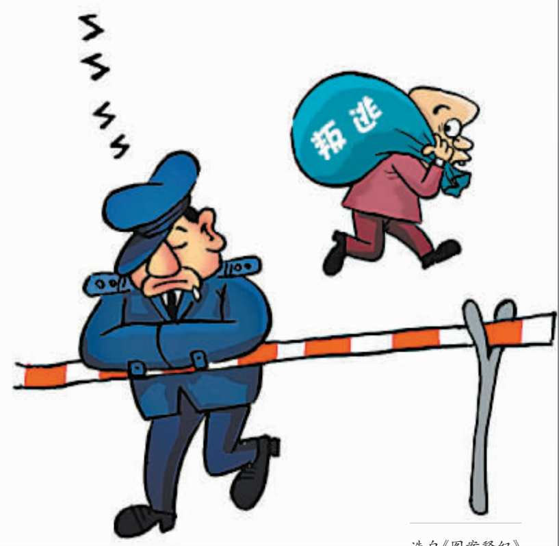
选自《以案释纪》 广州市纪委编

因工作不负责任致使所管理的人员叛逃的,对直接责任者和领导责任者,给予警告或者严重警告处分;情节严重的,给予撤销党内职务处分。 因工作不负责任致使所管理的人员出走,对直接责任者和领导责任者,情节较重的,给予警告或者严重警告处分;情节严重的,给予撤销党内职务处分。