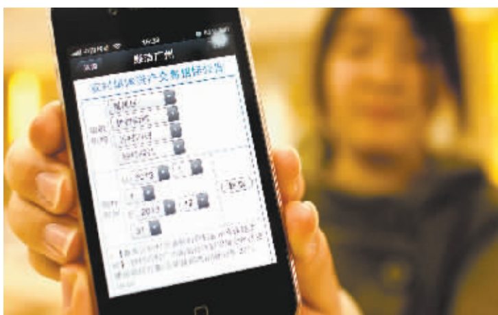
“廉洁广州”微信公众平台。

台已实现了农村“三公”信息查询、行政执法结果查询、市直各单位权力清单查询、公共资源交易信息查询等功能,试运行以来,公众互动查询2万余人次。下一步,还将建设