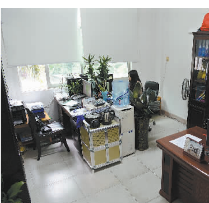
文冲街领导腾退办公室给街道经济发展科办公室。

日前,记者从广州市黄埔区了解到,该区认真落实中办17号文件精神,在全市10区2市中率先开展并完成清理办公用房工作,坚决反对“四风”,改善机关作风。此外,黄埔区在公务用车治理,提高会议效率,公务接待执行,规范干部出国(境),严控行政成本等方面,也取得明显成效。