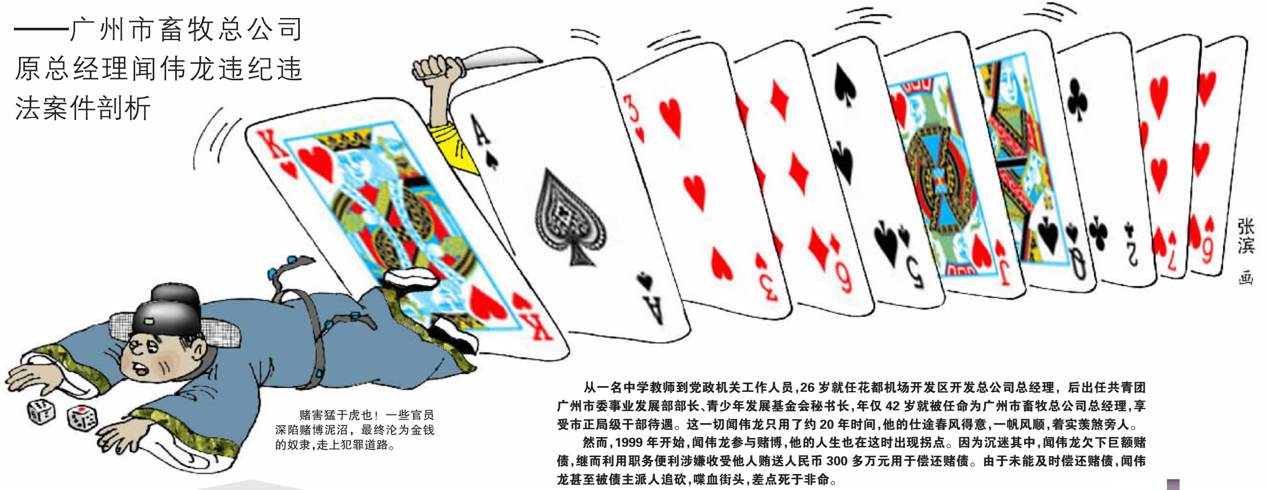
赌害猛于虎也!一些官员深陷赌博泥沼,最终沦为金钱的奴隶,走上犯罪道路。