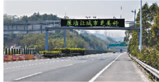
电子情报板滚动播放“廉洁让城市更美好”宣传标语。

广州日报讯(全媒体记者廖靖文 通讯员董广银 摄影报道)2017年春运期间,广州交通投资集团组织开展了“廉洁春运,平安回家”主题志愿服务活动,北环高速、机场高速、南沙港快速、西二环高速、珠江黄埔大桥、广河高速、增从高速、广明高速、新化快速、大广高速等十多条营运路段精心部署落实,除开展廉