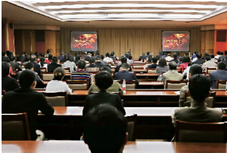
大家认真地观看专题片。

《打铁还需自身硬》是中央纪委宣传部、中央电视台联合制作的电视专题片,分《信任不能代替监督》、《严防“灯下黑”》、《以担当诠释忠诚》三集,片中展示了个别纪检监察干部的贪腐之路,欲念之贪婪、手段之大胆,令人触目惊心。此片在中央电视台播出后,引发社会各界良好反响,充分彰显了党中央全面从严治党的坚强决心。