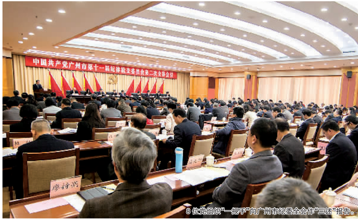
8位党组织“一把手”向广州市纪委全会作“三述”报告。