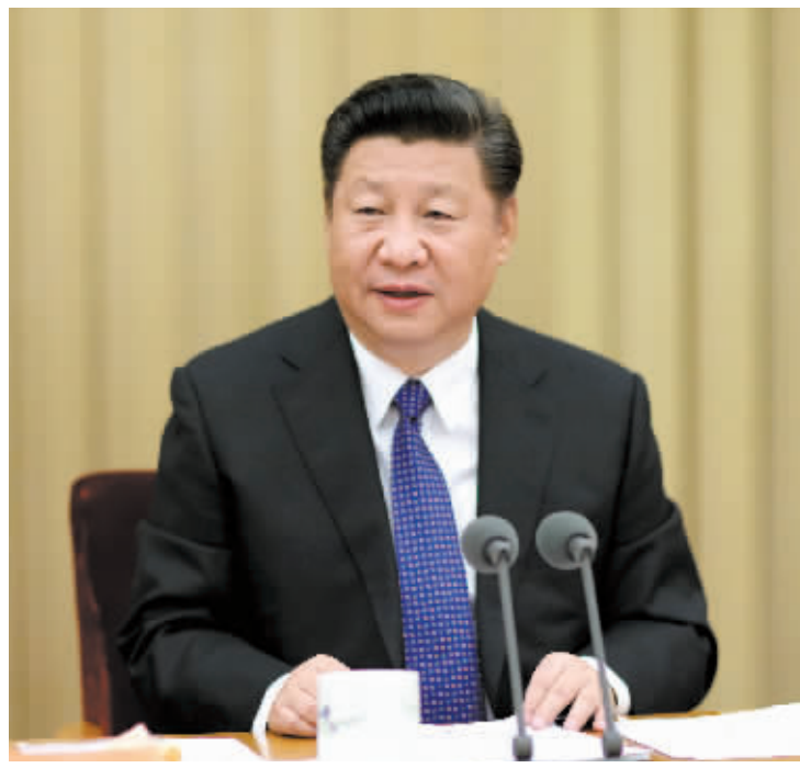
习近平出席全国国有企业党的建设工作会议并发表重要讲话。

据新华社北京 10 月 11 日电 全国国有企业党的建设工作会议 10 月 10 日至 11 日在北京召开。中共中央总书记、国家主席、中央军委主席习近平出席会议并发表重要讲话。中共中央政治局常委、中央书记处书记刘云山作总结讲话。中共中央政治局常委王岐山、张高丽出席会议。