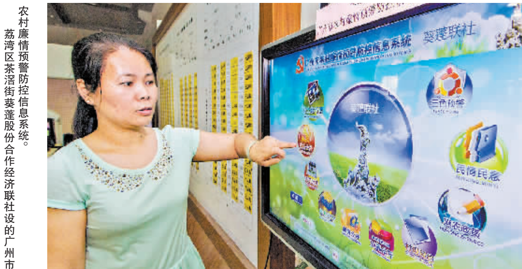
农村廉情预警防控信息系统。荔湾区茶滘街葵蓬股份合作经济联社社的广州市

据透露,去年以来,番禺全区纪检监察系统共立案查处党员领导干部涉及“八小时以外”的违纪违法问题55宗55人。