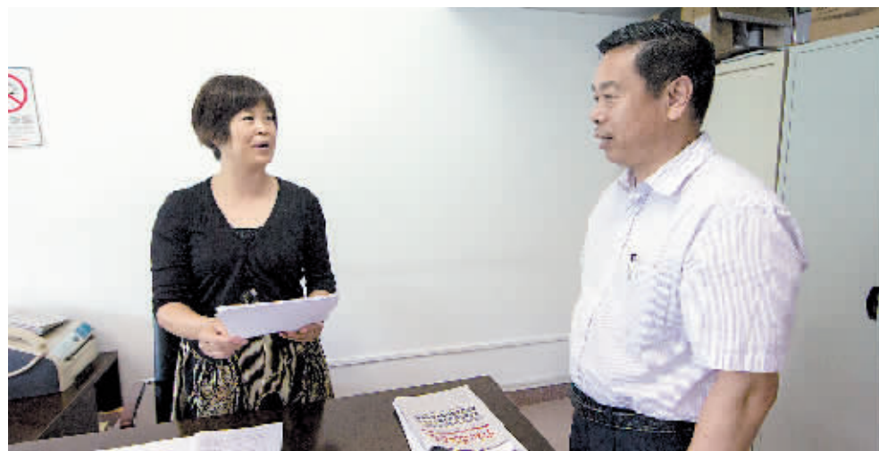
白云区党员领导干部模拟操办婚丧喜庆事宜向相关部门提交报告场景。