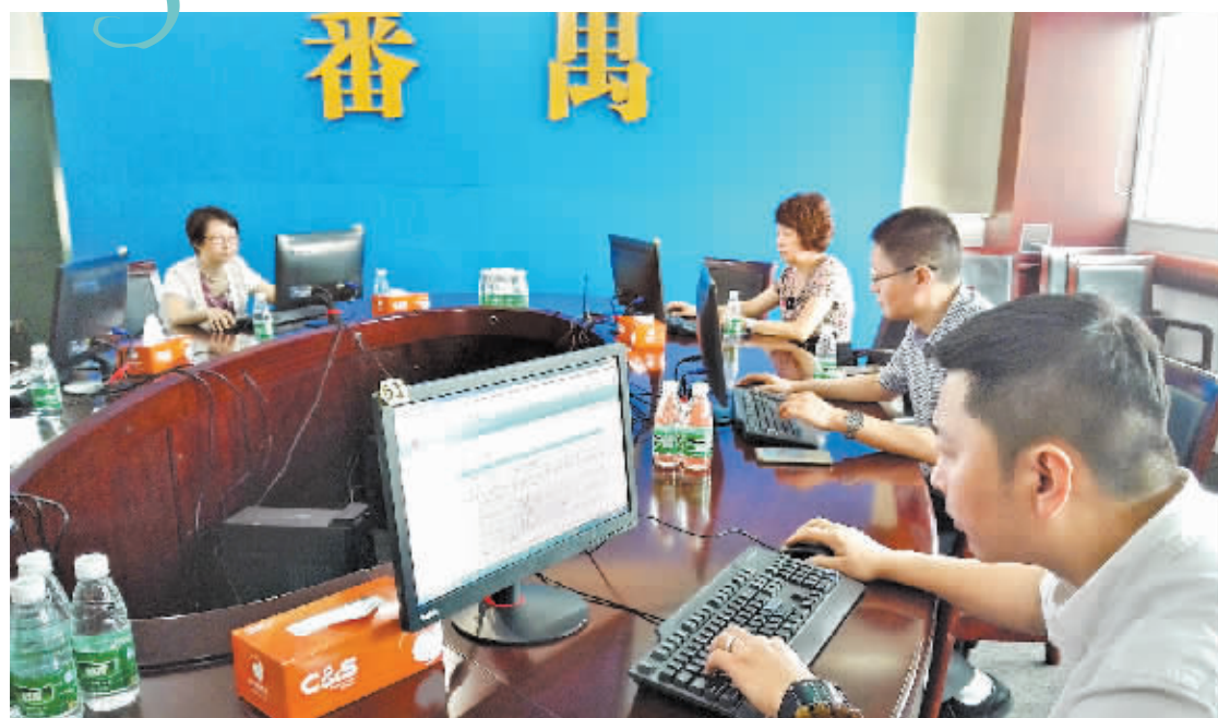
番禺区属国有企业相关负责人模拟操作区属国有企业智能防腐信息系统。