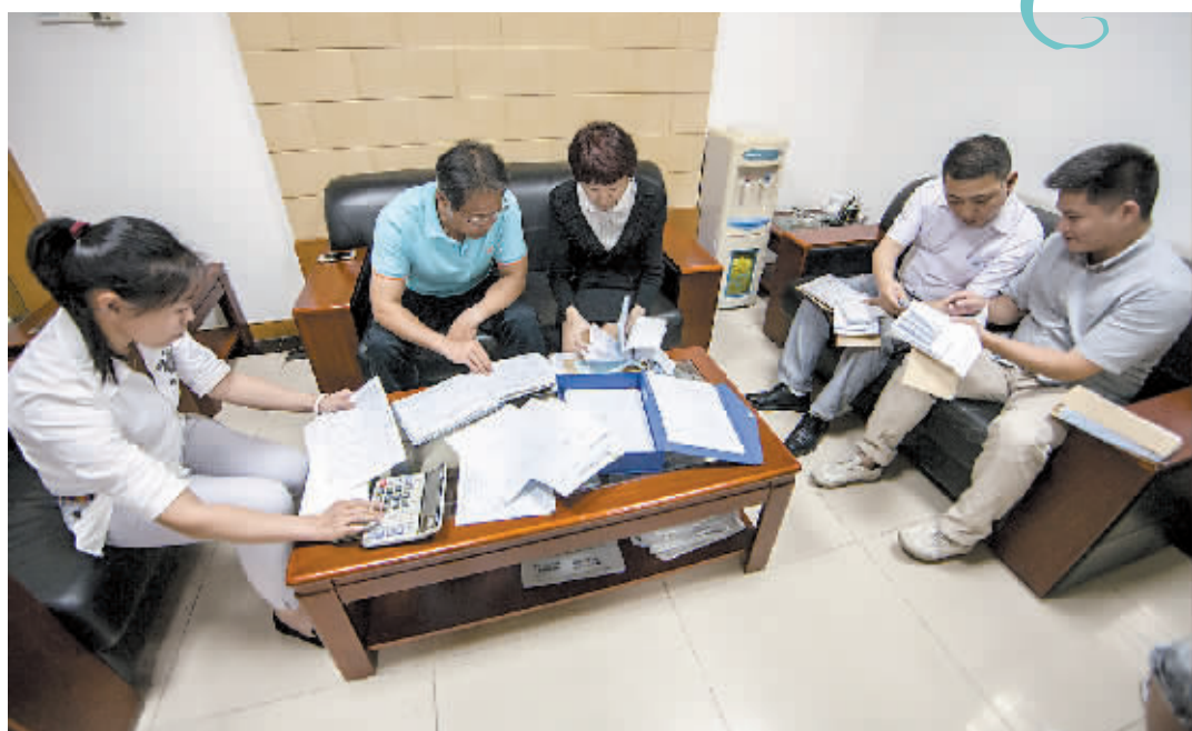
中共海珠区昌岗街道联星经济联合社纪律检查委员会委员模拟查账情景。