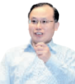
廉洁使者在认真听讲。