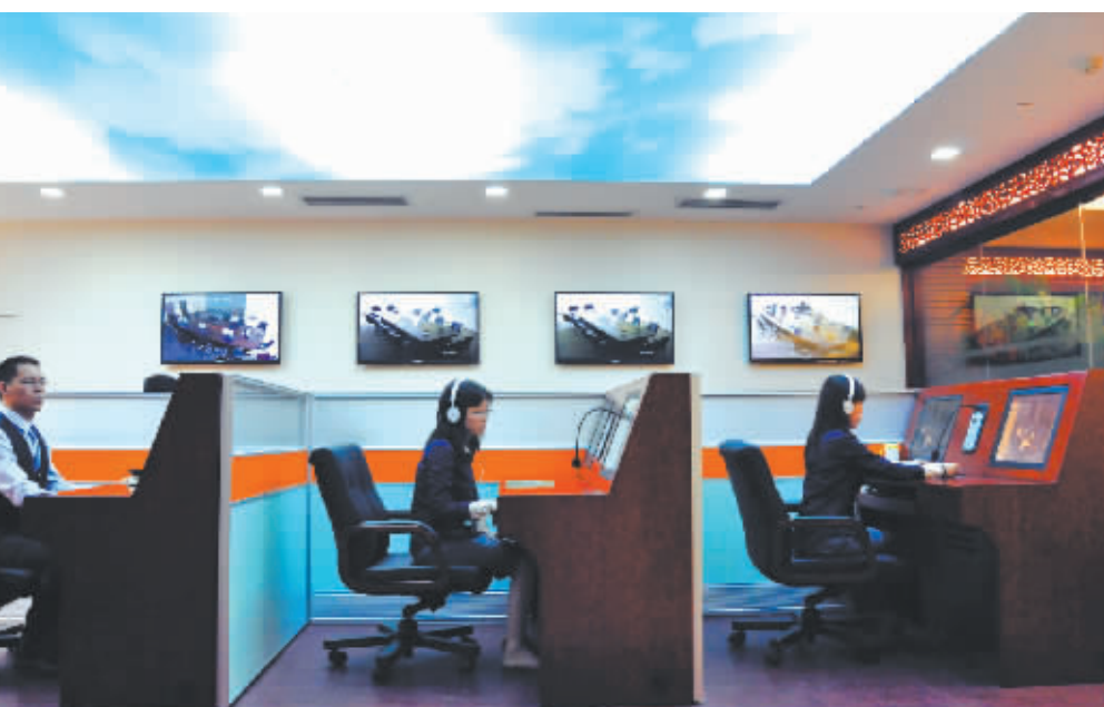
全国首创的数字见证模式,可最大限度有效实现专家独立评标。

在公共资源交易领域逐步进入电子化、信息化时代的新形势下,专家管理以及评标活动的监管成为公共资源交易领域一个重要的课题。2013年7月,广州公共资源交易中心成立,将原来分布于各级政府职能部门的公共资源进行统一公开透明的配置,构建阳光高效交易平台,也成为廉洁广州的重要品牌。