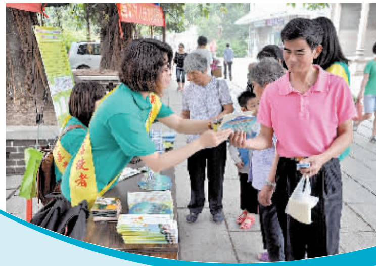
廉洁使者向居民派发廉洁文化宣传单张。