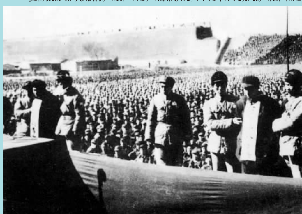
刘青山、张子善案公审大会。