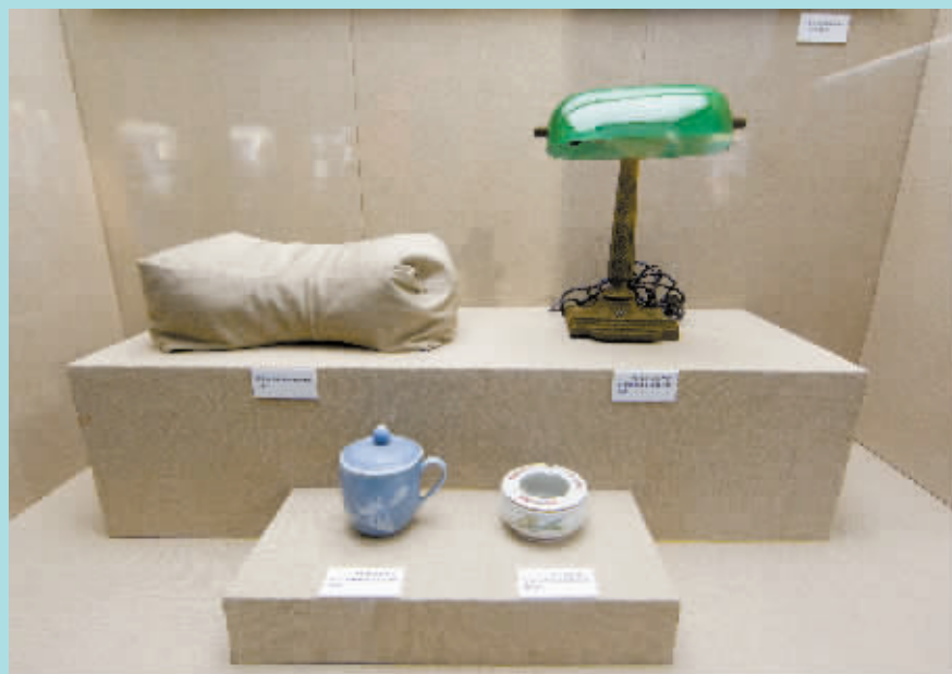
▲毛泽东使用过的枕头、台灯、茶杯和烟灰缸。