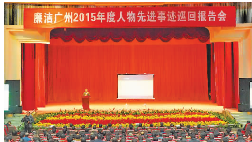
花都区分会场现场。

广州市纪委还印制了廉洁广州 2015 年度人物评选活动宣传海报 10 万张,拍摄制作了主题宣传片、先进事迹介绍片