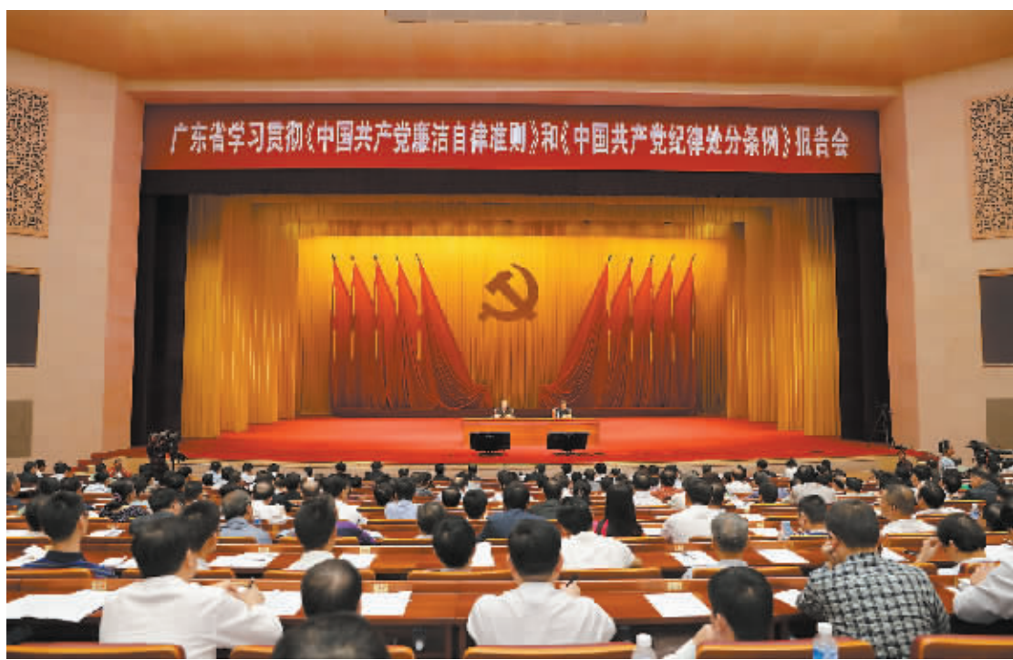
11月11日,广东省学习贯彻《中国共产党廉洁自律准则》和《中国共产党纪律处分条例》报告会举行。

据悉,广州市以电视电话会议形式组织收看收听。市委常委,市人大常委会、市政府、市政协党组成员,市法院院长、市检察院检察长,市纪委副书记,市人大常委会、市政府、市政协秘书长;市局以上单位、市管企业单位领导班子成员负责同志;驻穗单位党员主要负责同志;市纪委机关、派驻(出)机构全体党员领导干部在分会场参会。