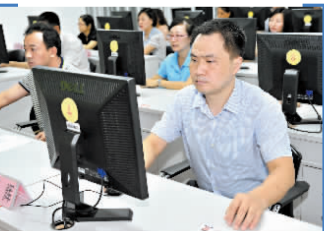
参加考试人员在认真答题。