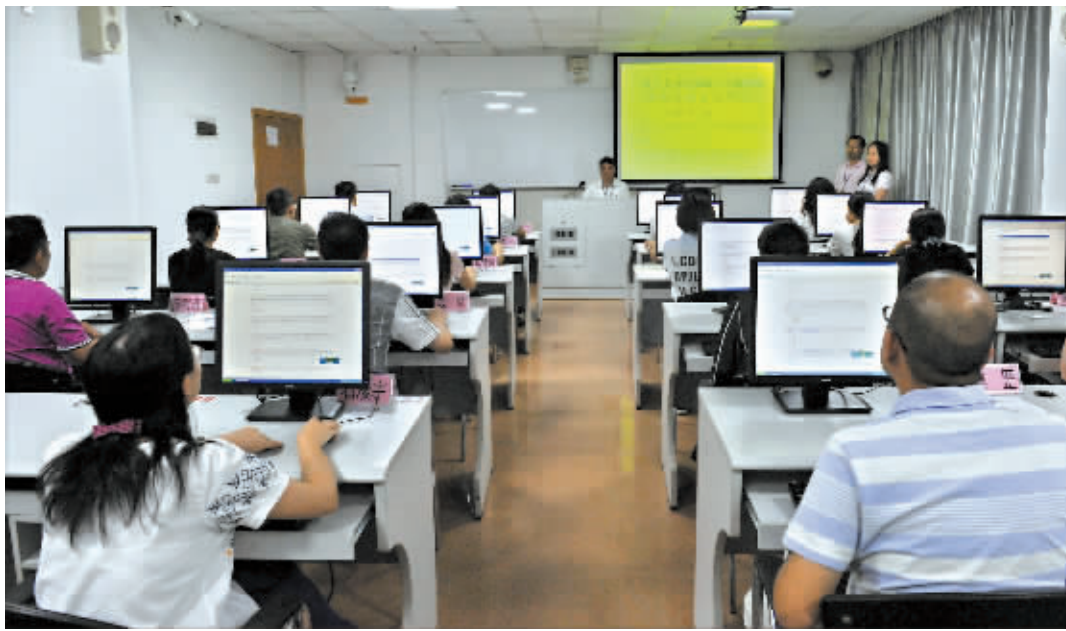
市人社局举行领导干部任前廉政考试。图为考试现场。