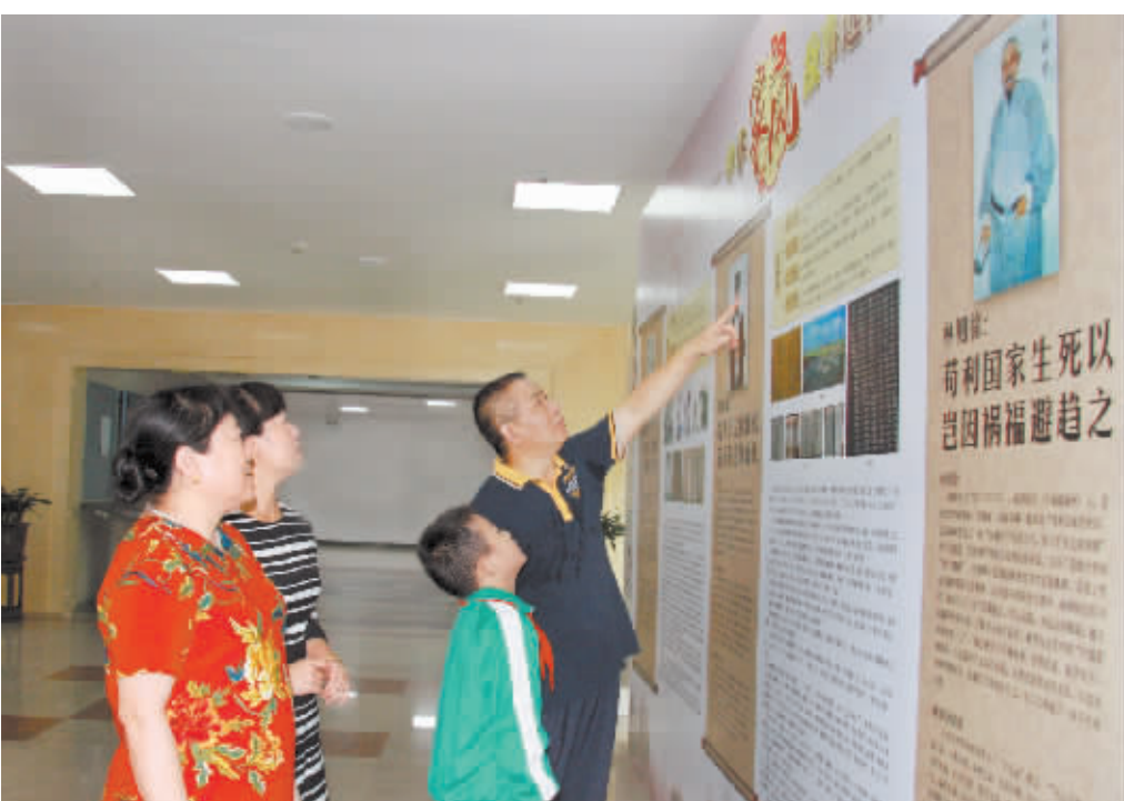
天河区举办的“家风弘美德 廉洁建天河”主题家风文化展。

举办主题家风文化展。天河区纪委联合区文广新局、区志办对天河本土历代地方名贤、姓氏先祖积淀下来的家书家训、文史典籍进行挖掘整理,组织举办了“家风弘美德 廉洁建天河”主题家风文化展,展示天河乡土名人族规家训、家风家教和祖先美德。创作系列家风作品。与暨南大学艺术学院合作创作了电影剧本《再见,雪客公主》,通过父子亲情阐述“廉洁才能幸福”的深刻道理,同时创作了《两部党内法规(摘选)绘本手册》,以形象生动的原创漫画让家风建设理念深入人心。全区各单位、街、社(村)齐齐参与,创作了小品《较量》、《三婶母》,快板短剧《好人好家》等系列家风作品,其中《好人好家》参加了市家风故事大赛并获“优胜奖”。评选先进家庭和个人。评选“天河区勤廉人物”、“天河最美家庭”和“天河好人”活动,树立先进典型,如全国“道德楷模”徐克成、廉洁广州年度人物周洁、“托举哥”周冲,最美家庭奥运冠军冼东妹家庭等,大力弘扬天河“好人物,好家庭,好家风”。