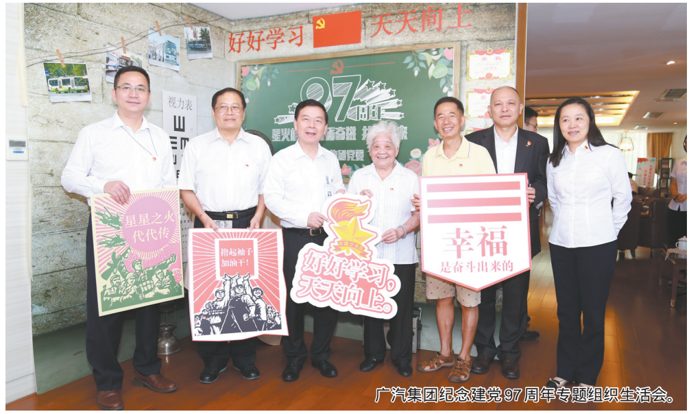
广汽集团纪念建党97周年专题组织生活会。

为全面加强和规范党内政治生活,增强党内政治生活的政治性、时代性、原则性、战斗性,推动全面从严治党向纵深发展,广汽集团党委按照市委印发的《广州市加强和规范党内政治生活三年行动计划(2018-2020年)》,强化主体责任意识,认真落实各项任务,将加强和规范党内政治生活工作纳入党风廉政建设年度考核,鼓励督促各级党组织加强探索创新,不断取得新成果。