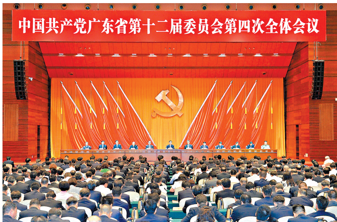
6月8日,中国共产党广东省第十二届委员会第四次全体会议在广州召开。

李希在讲话中指出,党的十九大胜利闭幕后,省委把学习宣传贯彻习近平总书记新时代中国特色社会主义思想和党的十九大精神作为头等大事和首要政治任务,组织开展大学习、深调研、真落实工作,迅速兴起学习宣传贯彻热潮。今年3月7日,习近平总书记参加十三届全国人大一次会议广东代表团审议发表重要讲话。省委把习近平总书记重要讲话精神,与习近平新时代中国特色社会主义思想、党的十九大精神、与习近平总书记对广东一系列重要指示要求一体学习领会、整体贯彻落实,并由省委常委会牵头对全面加强党的建设、推动粤港澳大湾区建设、解决发展不平衡不充分问题、推进全面深化改革、建设科技创新强省、构建开放型经济新体制、建设平安广东法治广东、推进生态文明建设、推进文化强省建设等九大课题进行深入调研,边学习边调研边推动落实,切实把习近平总书记重要讲话精神贯彻到广东工作的全过程各方面。大学习、深调研、真落实