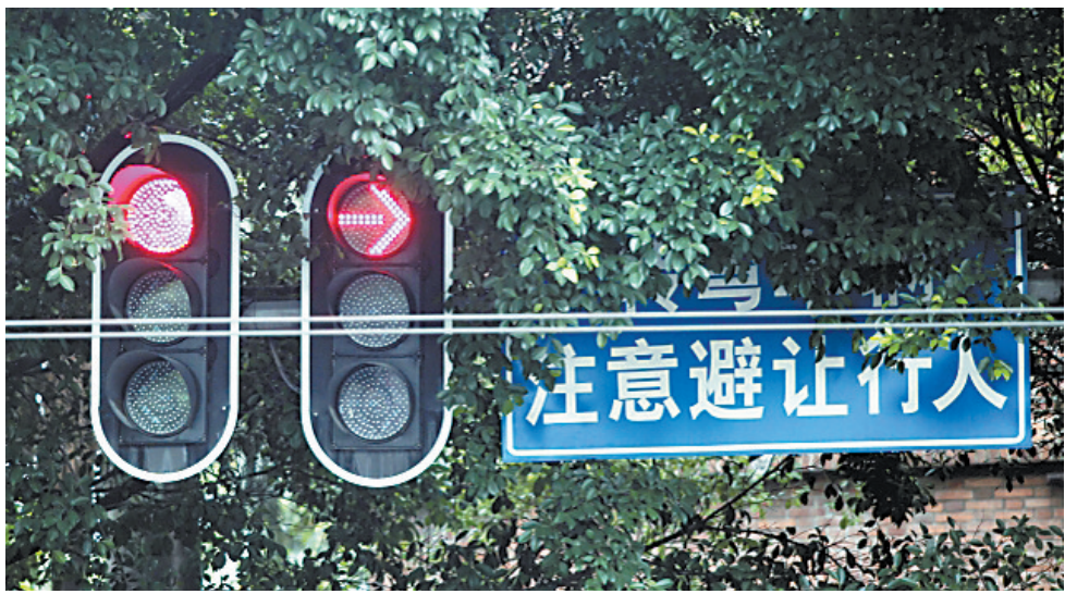
景观树枝繁叶茂,有时会遮挡交通信号灯,影响司机行车安全。(资料图)