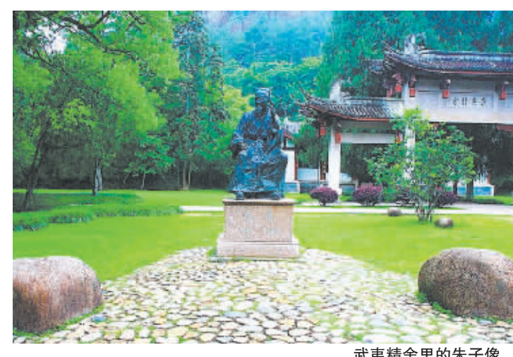
武夷精舍里的朱子像。

朱熹(1130年~1200年),字元晦,号晦庵,南宋江南东路徽州府婺源人(今江西省婺源县),出生于南剑州尤溪(今福建省三明市尤溪县),后长期生活在福建省崇安县五夫村,是中国古代著名哲学家、教育家、文学家,理学集大成者,被尊称为朱子,因谥文,又世称朱文公。