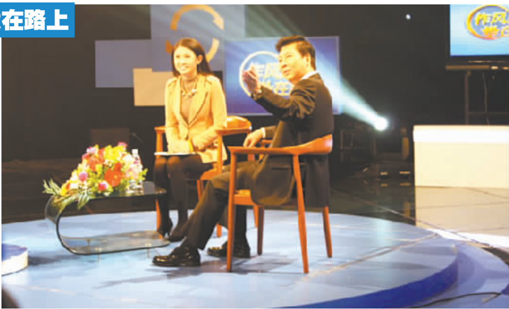
白云区区长在现场回答问题。