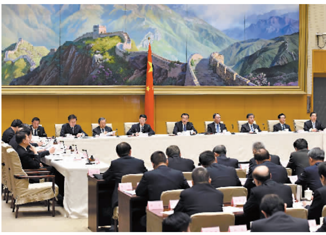
3月28日,国务院在北京召开第四次廉政工作会议,李克强发表讲话。