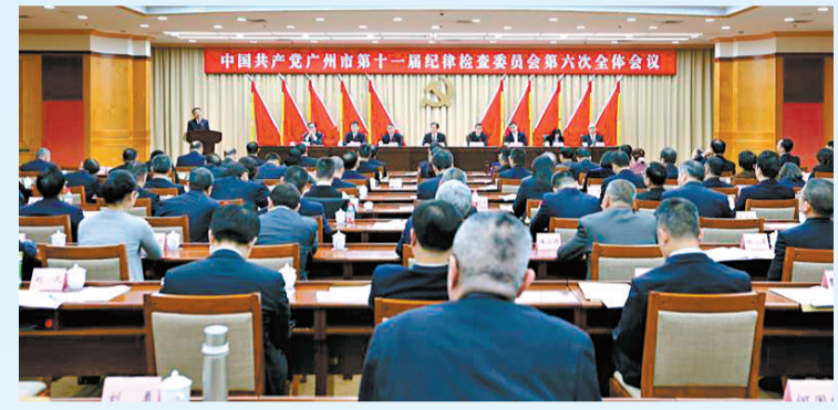
十一届市纪委六次全会召开述廉述职会议。

高质量发展的关键是高质量监督。近年来广州市纪委监委坚持定位向监督聚焦,力量向监督倾斜,责任向监督压实,推动监督体系融入国家治理、转化为治理效能。压实管党治党主体责任。强化协助职责、监督专责、推动作用,协助市委制定定期听取市人大常委会等单位党组履行全面从严治党主体责任情况报告暂行办法,出台落实党风廉政建设主体责任委员会工作规则,推动巡察监督与其他各类监督协作配合。做实落实监督,确保政令畅通。近年来,广州各级纪检监察机关立足新发展阶段,贯彻新发展理念,聚焦脱贫攻坚决战决胜,开展专项监督和专项巡察,建立完善与对口帮扶地区协同监督机制,2018年至2020年全市共查处扶贫领域腐败和作风问题107人,处分103人;主动对标世界银行评估排名要求,以专项监督督促各职能部门推进落实全面优化营商环境工作;规范直播带货等新兴业态标准,助力疫情期间民营企业复工复产;出台关于发挥职能作用保障促进民营企业改革发展实施意见,推动构建亲清政商关系……“两个维护”是具体的,实践的。从肃清李嘉、万庆良恶劣影响到督促抓好中央巡视反馈意见整改落实,从服务保障拆违治水到建设优化营商环境,从阻击“山竹”台风到抗击新冠肺炎疫情,紧紧围绕国之大者强化监督保障执行,已经成为全市纪检监察机关的自觉行动。