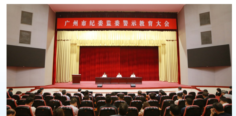
广州市纪委监委警示教育大会现场。

高质量发展是依靠高素质队伍保障的发展。近年来,广州始终坚持刀刃向内,以最严格的监督约束狠抓自身建设,以铁一般的纪律作风锻造忠诚干净担当的纪检监察铁军。注重固根本、强素质,把政治建设摆在首位。广州市纪委监委带头加强政治建设,落实机关党建责任制,坚持集体学习“第一议题”制度,巩固拓展主题教育成果。市纪委监委扎实开展“以案为鉴正衣冠、以身作则作表率”党员干部警示教育工作,把对党员干部的教育监管纳入党支部书记述职评议考核以及党支部评星定级评价重要内容,并公开通报考评结果;对排名靠后的,由分管领导及机关党委约谈党支部书记;对因党员干部教育监管不力导致党支部建设出现严重问题的,按照规定严肃问责,并对不适宜担任党支部书记的予以调整。注重打基础、利长远,不断优化干部队伍梯次结构。召开全市纪检监察系统组织建设工作会,严把纪检监察干部“入口关”,探索开展道德品行专项考察,强化正确选人用人导向。扩大选人视野,多渠道选调干部,推动系统内外交流轮岗。完善信访锻炼、以案代训、跟班学习、参与巡察等制度安排,实行新进公务员多岗位锻炼和基层挂职锻炼。制定实施市纪委监委干部培训制度,建立片区纪检监察业务培训协作机制,举办多